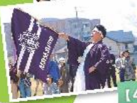
【4月】築館高校定期戦