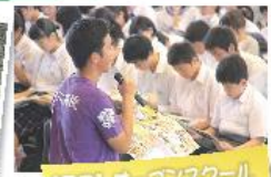
【7月】オープンスクール